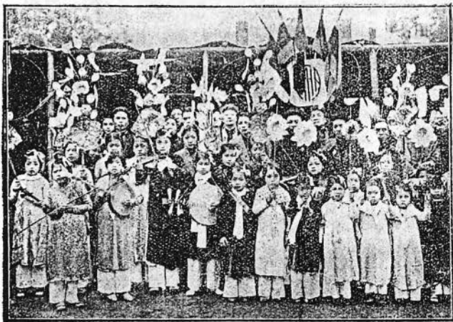
Ban nữ đồng-ấu vào chúc mừng vị Thuyền-gia Pháp-chủ