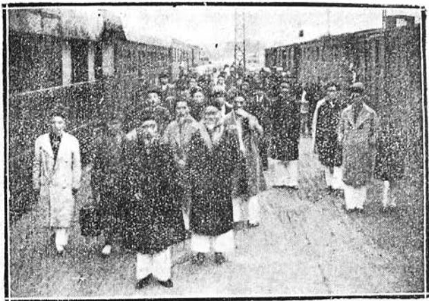
Lúc ở sân ga, hội-viên hội Phật-giáo Bắc-kỳ tiếp rước các đại-biểu hội Phật-học Trung-kỳ ở Huế mới ra