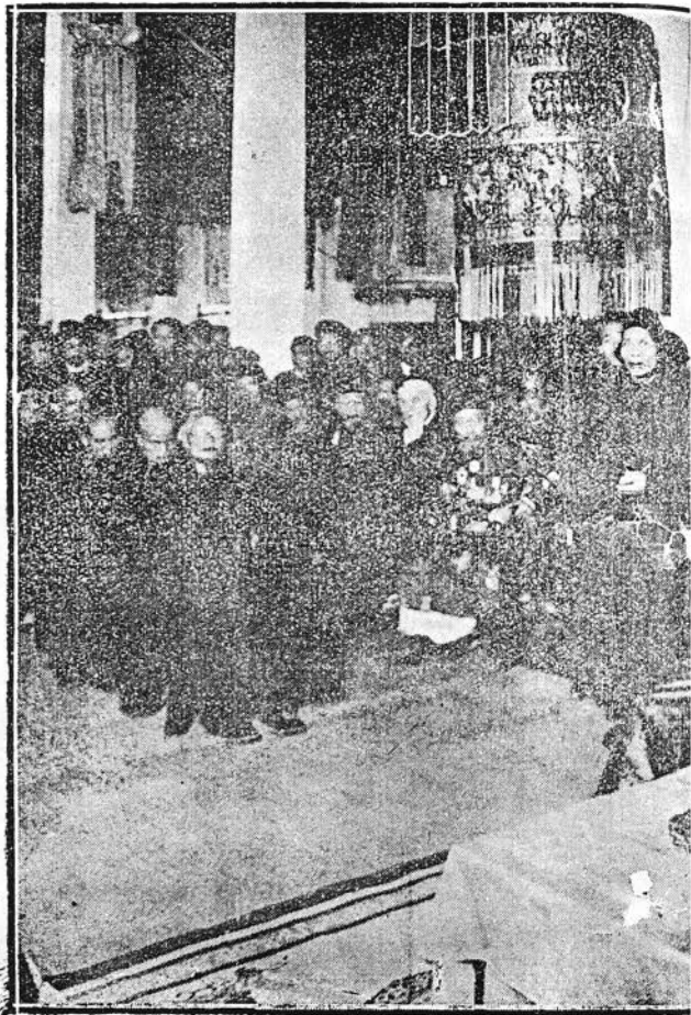
Lúc làm lễ suy-tôn Thuyền-gia Pháp-chủ, Cụ C