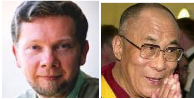
1 st Eckhart Tolle 2 nd Dạt Lai Lạt Ma 14

(Thân thể không già), Timeless Mind (Tâm thức phi thời gian) và The Seven Spiritual Laws of Success (Bảy định luật tâm linh để thành công).