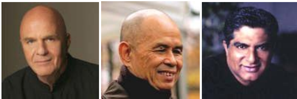
3 rd Wayne Dyer 4 th Thích Nhất Hạnh 5 th Deepak Chopra

Năm nhân vật tiếp theo trong Top-Ten của danh sách 100 vị này là nữ tác giả Mỹ Louise Hay , nhà văn Brazil Paulo Coelho , nữ điều hợp viên chương trình đàm thoại truyền hình Mỹ Oprah Winfrey , triết gia Mỹ về tiến hóa tâm linh Ken Wilber , và nhân vật thứ mười là nhà nữ sản xuất truyền hình Úc Rhonda Byrne .