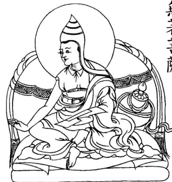
Bồ-tát Vô Trước (Asanga)

khéo hơn hết đều gốc ở Bạch-sa-ngõa . Lúc trước người ta không dám đúc tượng Phật, cho nên không đâu có. Bỗng đâu, ở Bạch-sa-ngõa có một thiếu niên đúc hình Phật theo như người thật. Rồi từ đó mấy nước gần đều đến thỉnh về. Dần dần, đảo Tích-lan , 1 Trung Hoa, Nhật Bản, chỗ nào cũng đều biết đúc tượng Phật dựa theo người Bạch-sa-ngõa .