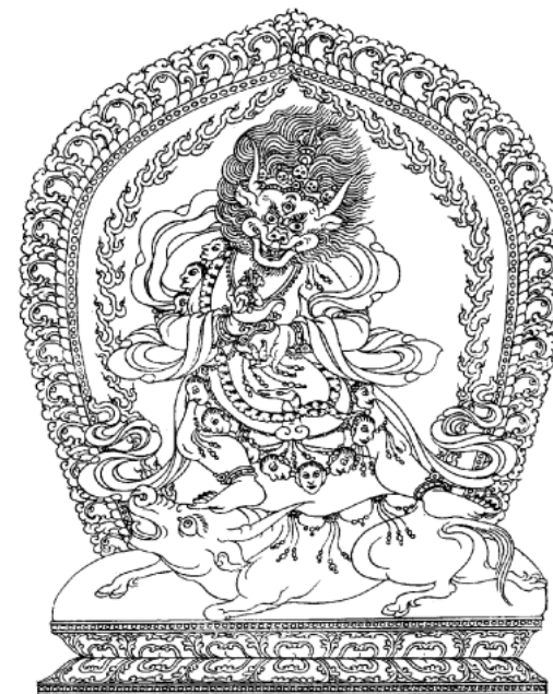
Dharmapala – Hộ Pháp luận sư

Đạt-ma-ba-la . 1 Vị này vẫn đứng đầu chùa này cho đến khi thị tịch vào năm 560. Đạt-ma-ba-la là đệ tử ngài Trần-na 2 mà ngài Trần-na chính là học đạo với hai vị Bồ-tát Vô Trước và Thế Thân. Huyền Trang may gặp được ngài Giới Hiền đúng là dòng pháp như đại thừa, được vị này truyền dạy cho pháp môn Duy thức. Về sau, nhờ đó mà Ngài soạn được bộ Thành duy thức luận 3 được xem là bộ sách cốt yếu và khái quát nhất của Duy thức tông.