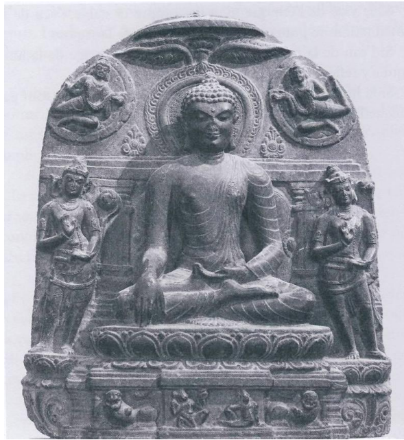
Đức Phật chạm tay xuống mặt đất để chứng minh cho sự chiến thắng của mình trước bọn ma vương (điêu khắc nổi thuộc triều đại Pala-sena, Ấn Độ, thế kỷ thứ X, đá Basalt màu đen, bảo tàng viện Guimet-Paris)