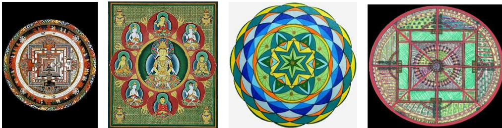
Vài thí dụ về mạn-đà-la (do người dịch thêm vào)

Biểu tượng tỏa rộng sự toàn vẹn của nó dưới tất cả mọi thể dạng, thí dụ như biểu tượng gọi là mạn-đà-la chẳng hạn. Mạn-đà-la biểu trưng cho sự quán thấy về thế giới trong thể dạng đồng nhất của nó. ( mạn-đà-la là một thuật ngữ dịch âm từ tiếng Phạn mandala, có nghĩa là một vòng tròn, nếu hiểu rộng ra thì có thể xem đây là một bầu không gian biểu trưng cho một sự thiêng liêng mang tính cách vừa tượng hình lại vừa trừu tượng, dùng làm nền tảng trợ giúp cho việc thiền định hay sự quán thấy ).