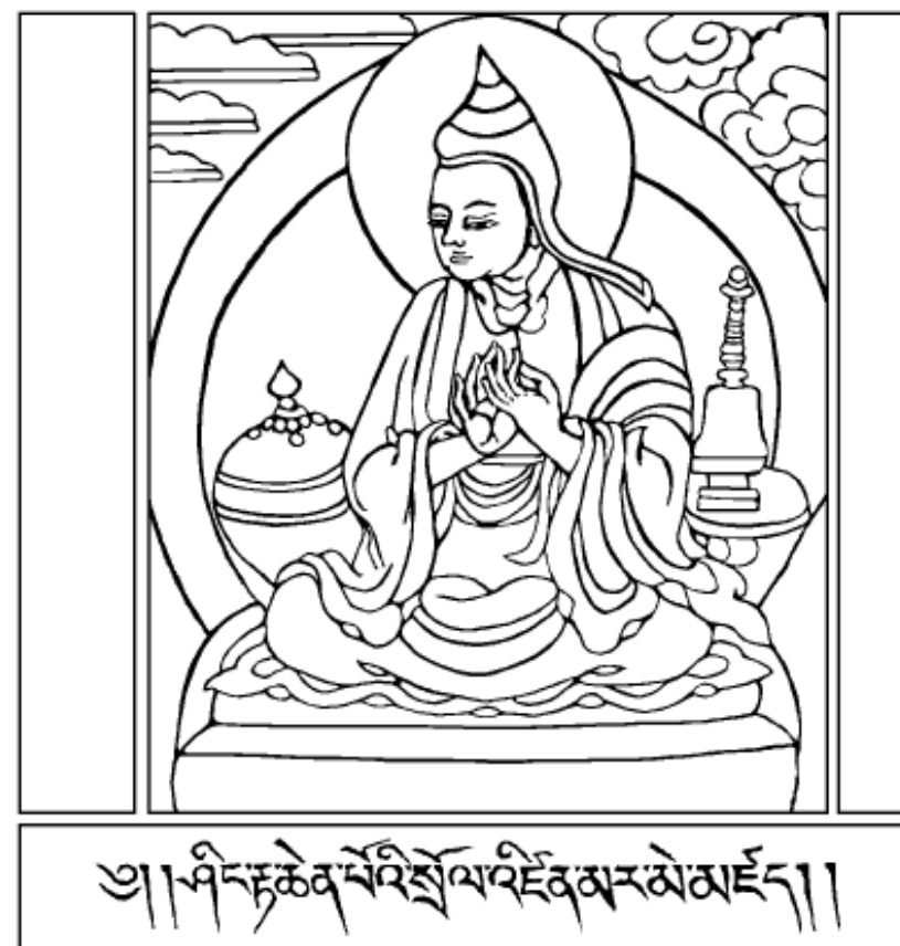
Thánh Atisha (980-1052)

Gặp lúc thể xác tinh thần đang gặp nhiều khổ não, không có gì mang lại nhiều lợi lạc hơn là hành trì pháp