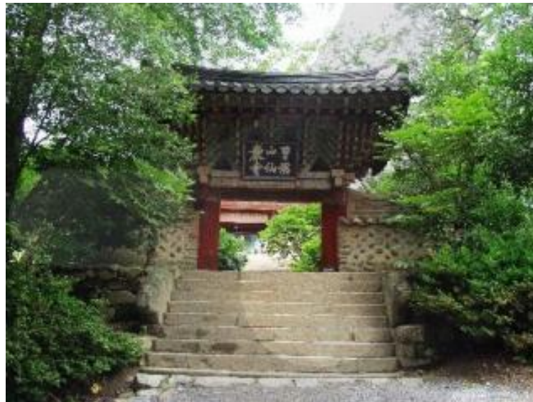
Thiền phái Thái Cổ xuất thân từ dòng thiền Tào Khê, Trung Quốc. do Thiền sư Phổ Ngu là vị Sơ tổ người Hàn Quốc sáng lập 太古普愚( 태고보우) 1301–1382