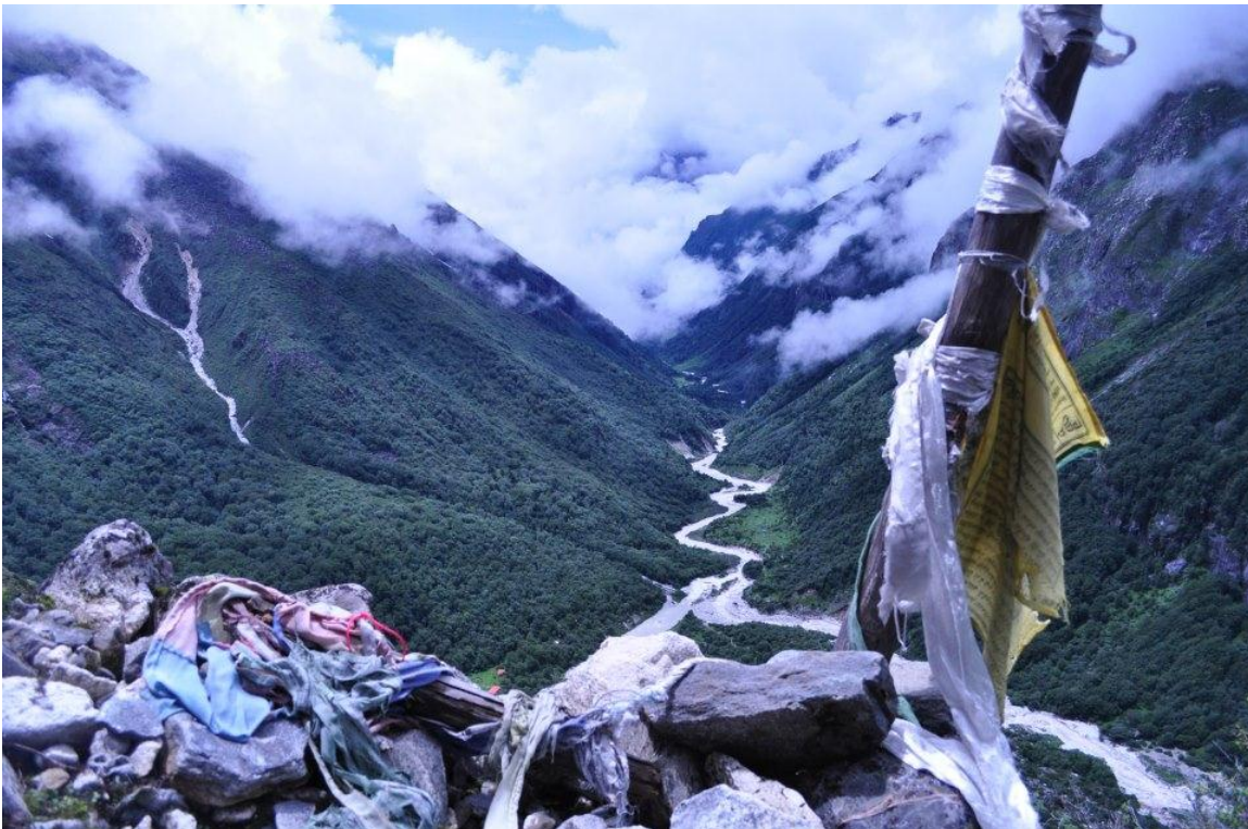
Núi thiêng Lapchi