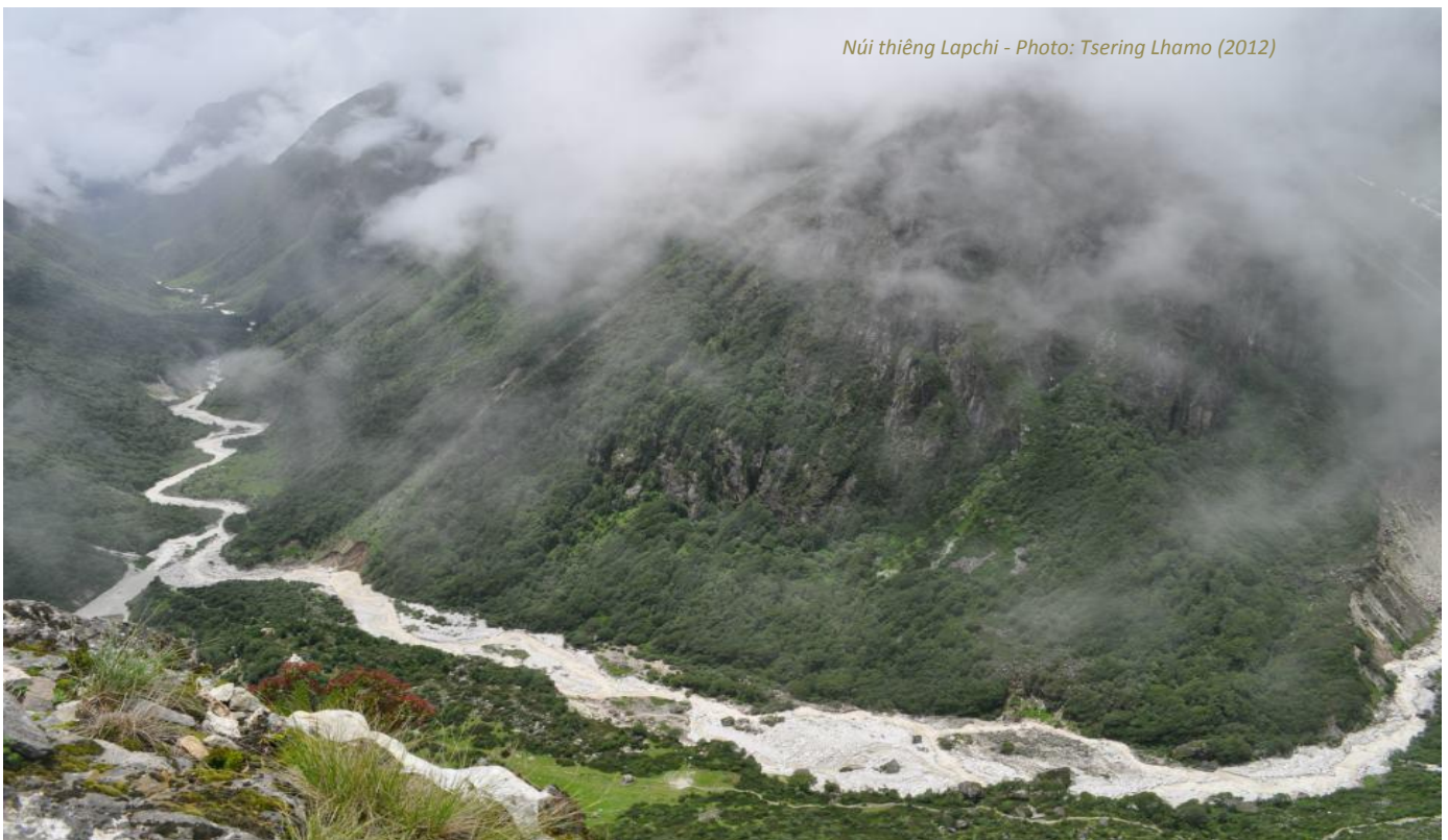
Núi thiêng Lapchi - Photo: Tsering Lhamo (2012)

Đây là những lời dặn dò và di huấn cuối cùng của ta. Ôi Rechung, chẳng còn gì để nói thêm được nữa. Con trai ta ơi, hãy luôn quy ngưỡng, Hương trọn lòng mình đến những giáo lý ấy.