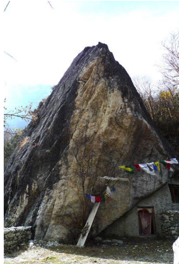
Thiền Động Tiên Tri (Lungten Phug).

Một hành giả giáo pháp vương kẹt trong ngôn từ ước lệ, Chẳng thể nào liễu ngộ rốt ráo khi ứng dụng cho tâm. Đây là một kẻ không có hạnh phúc dù bất kỳ lúc nào. Đây là một kẻ luôn luôn đắm chìm trong đau khổ.