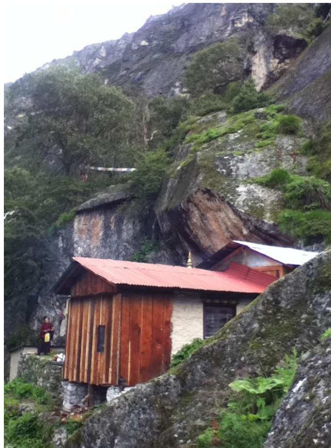
Thiền thất của Garchen Rinpoche nối vào Động Hàng Ma. Photo: TBD (2012)

Một hành giả giáo pháp luôn vướng kẹt và phản ứng trước các hiện tượng, Những điều ưa thích và không ưa thích do họ tự chất chồng. Đây là một kẻ không có hạnh phúc dù bất kỳ lúc nào.