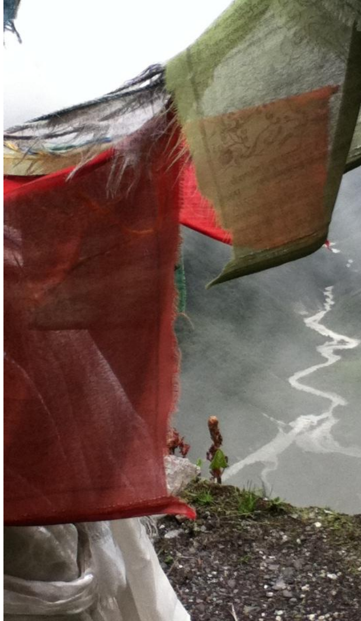
Đỉnh Se Phug tại núi Lapchi nơi Milarepa đã bay cao và để lại dấu chân trên đá

Còn các hiện tượng của sáu loại đối tượng khi đối diện với sáu thức thì sao? Ngay cả đôi tay của các Đấng Chiến Thắng