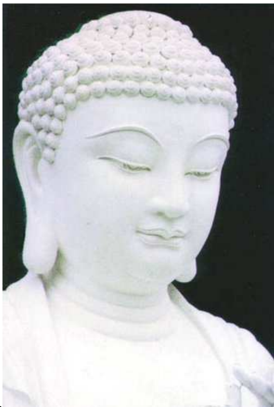
Nam Mô Thích Ca Mâu Ni Phật