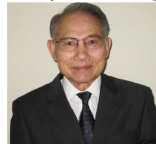
Hình chụp ngày 29/8/2010