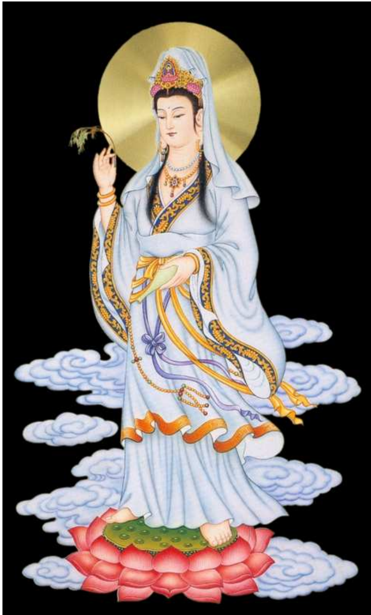
Nam mô Đại Bi Quán Thế Âm Bồ Tát

Hình tượng thờ Ngài đứng bên tay trái của đức Phật A Di Đà. Có người thấy mặt đẹp và dáng Ngài xa xa, các giải mũ, tà áo bay theo chiều gió lá lướt tựa thể Tiên nữ, nên đã cho rằng Ngài là đàn bà. Sự thật chẳng phải vậy, vì khi tu đã tới bậc “Đẳng Giác Bồ Tát” như Ngài, nghĩa là chỉ còn một bậc nữa là thành Phật. Ngài có đủ thứ thần thông biến hóa, đâu còn tham dự của người tục tử như chúng ta nữa. Ngài đâu còn có tính của một người đàn ông hay đàn bà phàm tục nữa, nghĩa là Ngài đã ra ngoài vòng “ái dục”, và chỉ có một mục tiêu làm việc Phật, cứu độ chúng sinh. Nếu chúng ta theo trần tục mà gán ghép cho Ngài là Nam hay là Nữ, chắc Ngài phải tức cười về “những người mù sờ voi” không biết sự thật, và thương xót chúng sinh mê muội mãi trầm luân trong biển khổ!