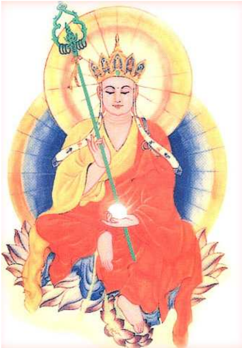
Nam mô đại Nguyên Địa Tạng Vương Bồ Tát