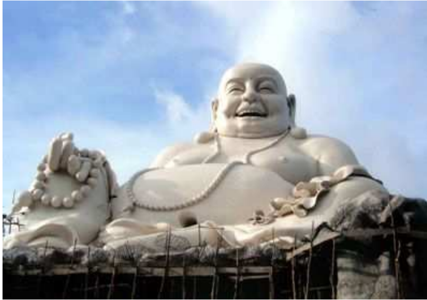
Nam Mô Đương Lai Hạ sinh Di Lạc Tôn Phật

thân, ý, sáu trần tượng trưng cho sắc, thanh, hương, vi., xúc, pháp, và sáu thức là nhãn thức, nhĩ thức, tỷ thức, thiệt thức, thân thức, ý thức. Vị chi là 18 giới hết thảy.