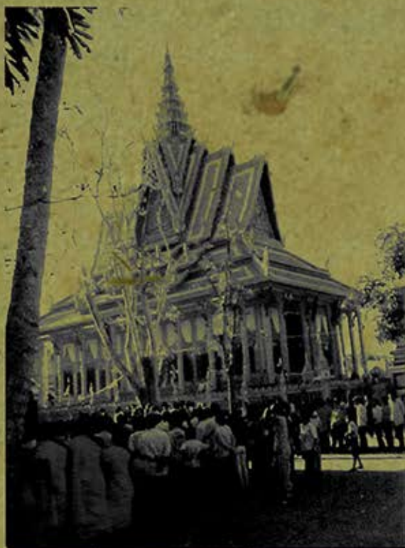
Lễ kiết giới seima chùa Trà Nóc (xã Song Lộc, H.Châu Thành, tỉnh Trà Vinh) ngày 22/3/2009. (Ảnh chụp năm 2009)