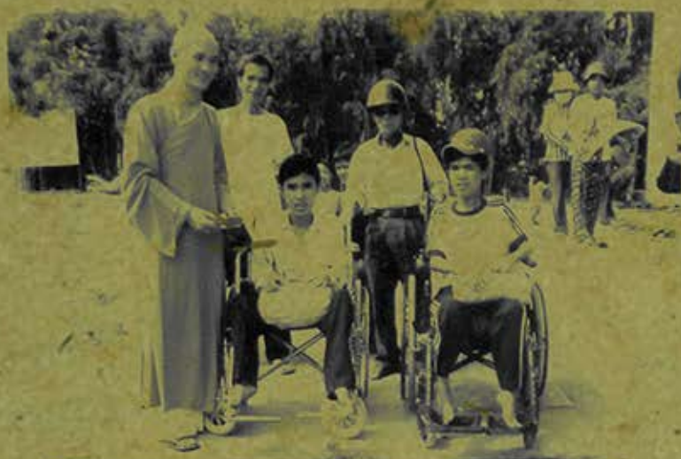
ĐOÀN TỬ THIÊN XÃ HỘI TẶNG QUÀ CHO CÁC EM KHUYẾT TẬT NHÂN NGÀY TẾT NGUYÊN ĐÁN TẠI XÃ BÌNH PHÚ - HUYỆN CHÂU PHÚ - TỈNH AN GIANG

Đoàn từ thiện xã hội Phật giáo tặng quà cho trẻ em khuyết tật H.Châu Phú, Tỉnh An Giang. (Ảnh chụp năm 2007)