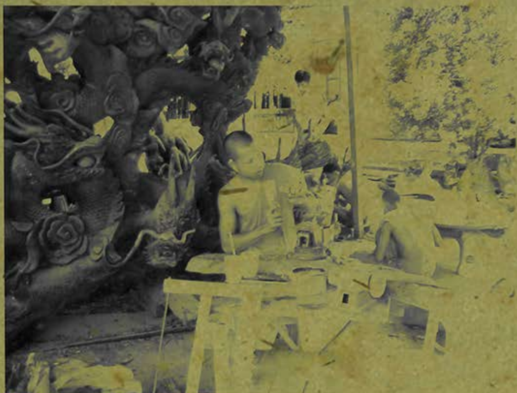
Chạm khắc tượng gỗ trong chùa Hang (Trà Vinh). (Ảnh chụp năm 2009)