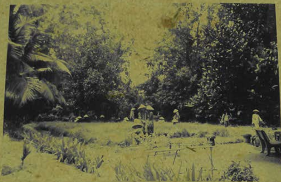
Các ni cô thiên viện Viên Chiêu (Đồng Nai) đang cấy lúa. (1997)