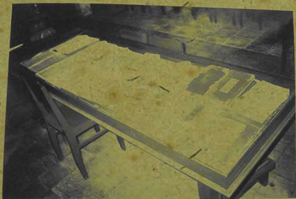
Kinh sách chữ Hán đang lưu giữ tại chùa Bửu Lâm (Đồng Tháp). (Ảnh chụp năm 2008)