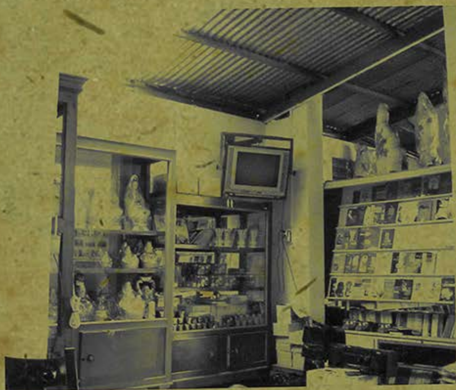
Phòng phát hành kinh sách chùa Viên Quang (An Giang). (Ảnh chụp năm 2007)