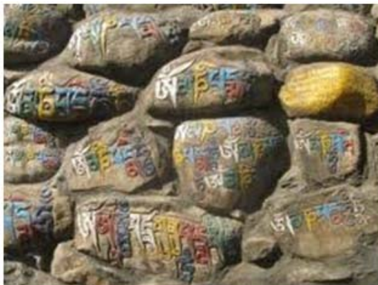
Hình 6: Thân chủ Lục Tự được khắc trên bánh xe cầu nguyện và trên đá ở Tây Tạng