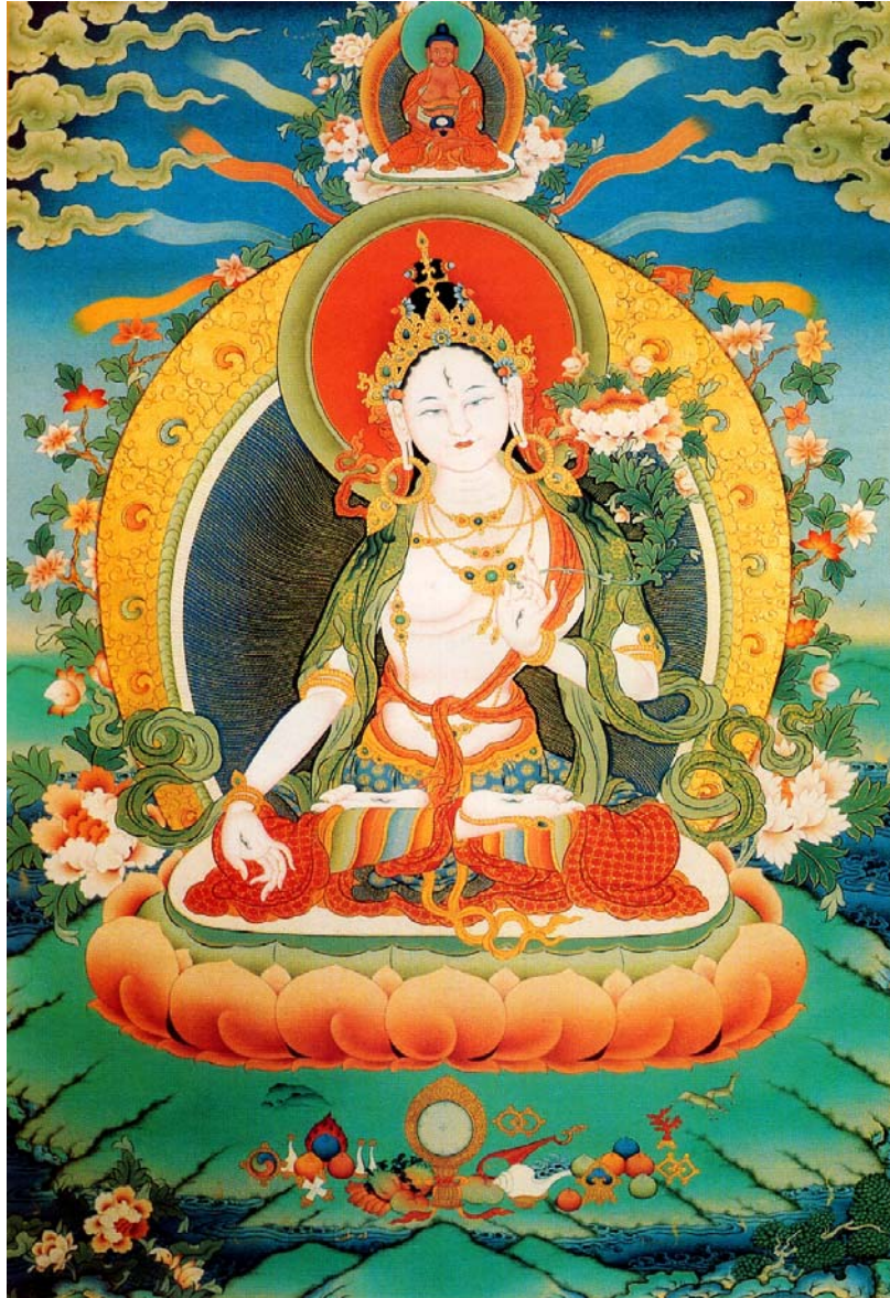
Hình 4: Đức Tara Trắng