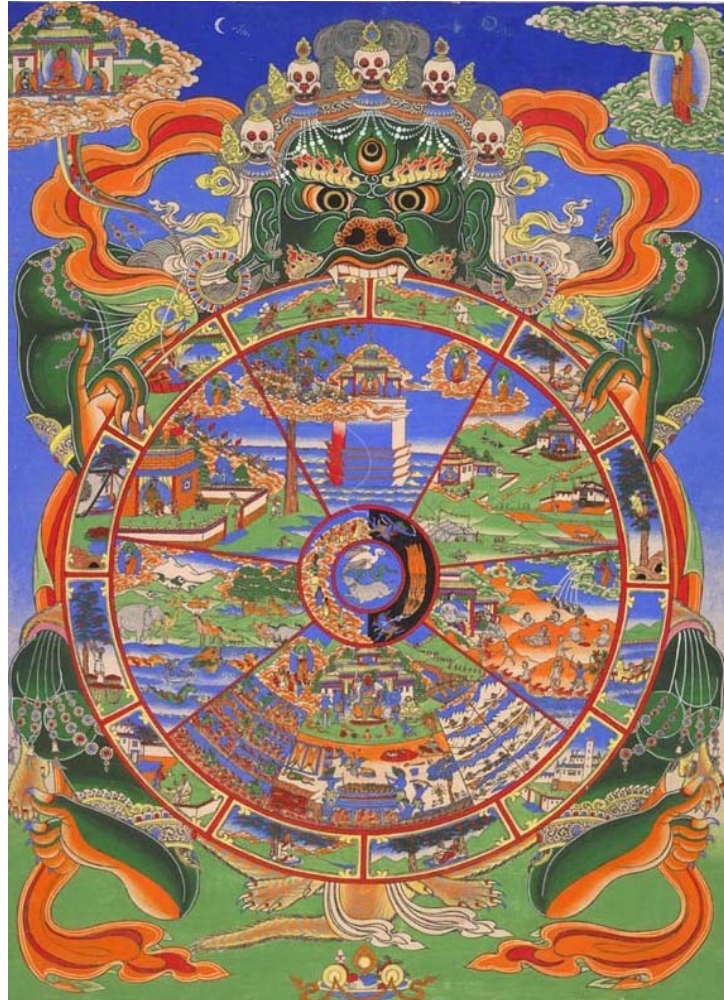
Hình 11: Vòng luân hồi theo Phật Giáo Tây Tạng