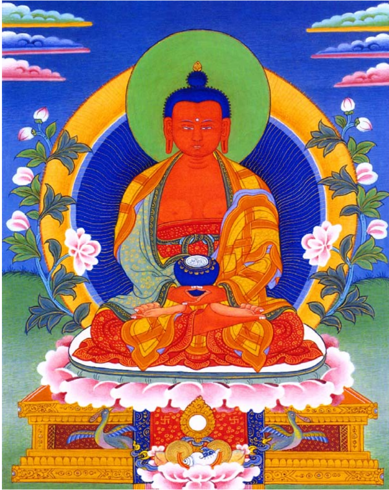
Hình 12: Đức Phật A Di Đà (Amitabha, the Budha of Infinite Light)

Bây giờ chúng ta sang chương thứ 7 để khảo sát về Đức Phật này và cảnh giới Cực Lạc của Ngài như là