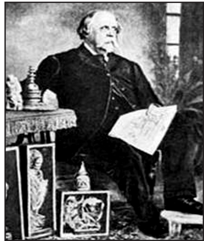
4. Ngài Sir Alexander Cunningham, Nhà Khám phá Di Sản Phật Giáo ở Ấn Độ (1891-1956)