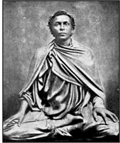
2. Ngài Tỳ Kheo Anagarika Dhammapala, Người sáng lập Hội Đại Bồ-Đề Ấn Độ (1864-1933)