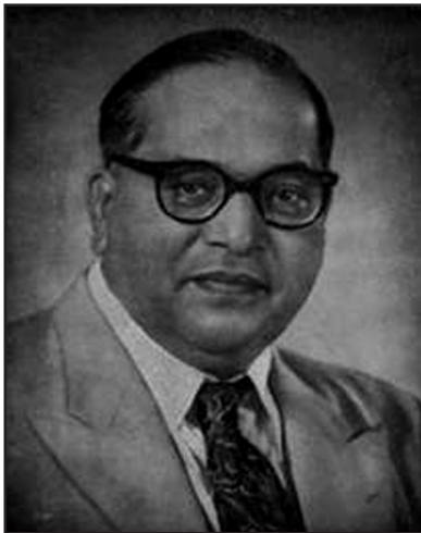
3. TS. Babasaheb Ambedkar, Người Dẫn Đầu của Những Người Giai Cấp Hạ Tiện (1814-1893)